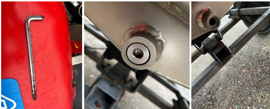
Abbildung 2: Schraube zum Unterboden entleeren mit 10er Inbus