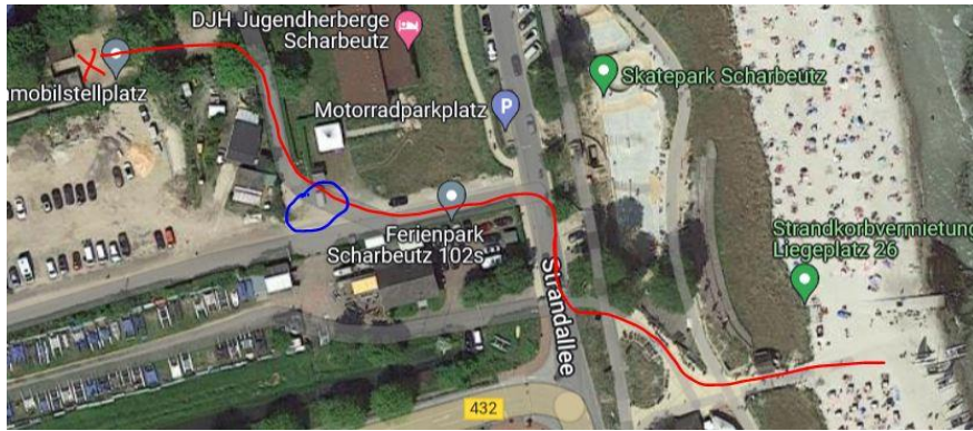
Abbildung 1: Standort Garagen und Poller