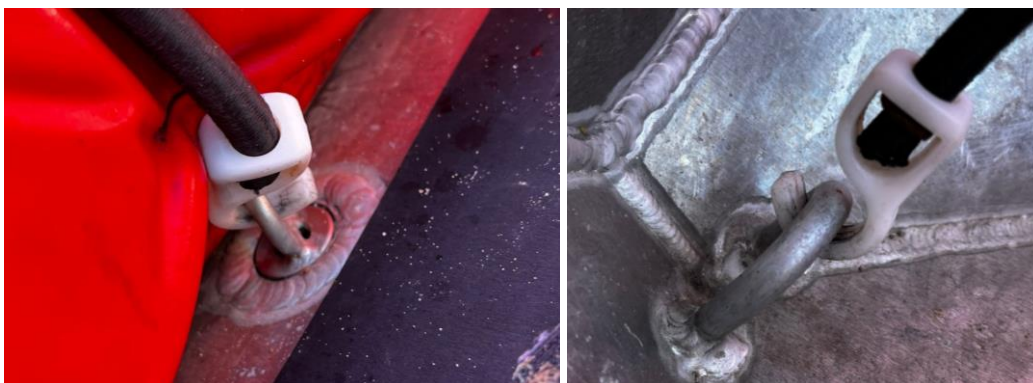
Abbildung 4: Spanngummi mit Hacken (Öffnung immer nach oben)